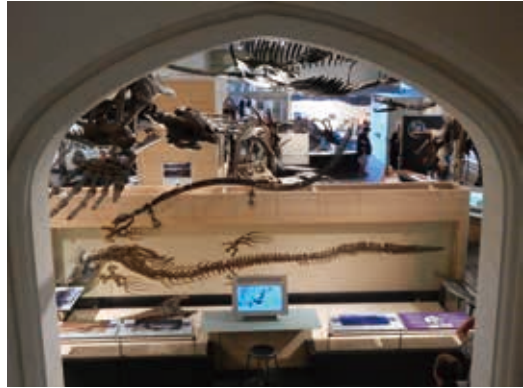
圖2 加拿大自然博物館擁有超過1千萬件標本，保存加國珍貴自然歷史遺產