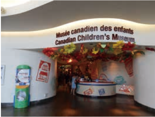
圖7 加拿大歷史博物館內的加拿大兒童博物館