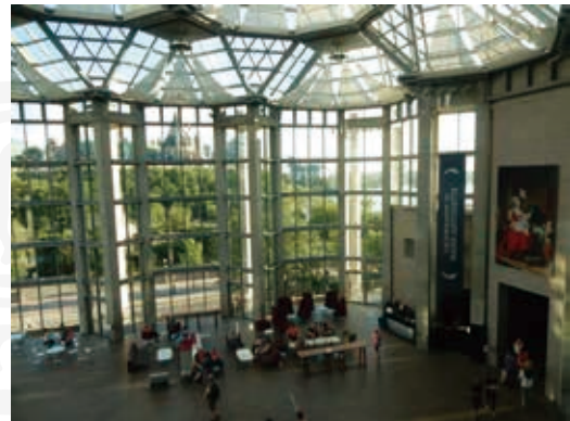
圖10 加拿大國家美術館大廳眺望渥太華國會大廈壯美建築