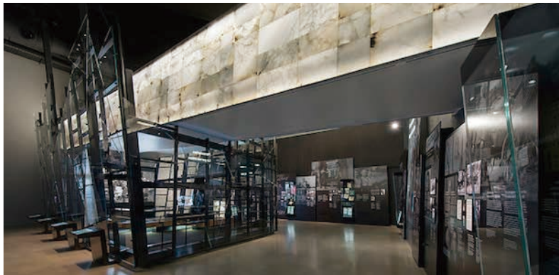
圖18 加拿大人權博物館展廳五：檢視猶太人屠殺及其他種族滅絕行動 Examining the Holocaust and other Genocides