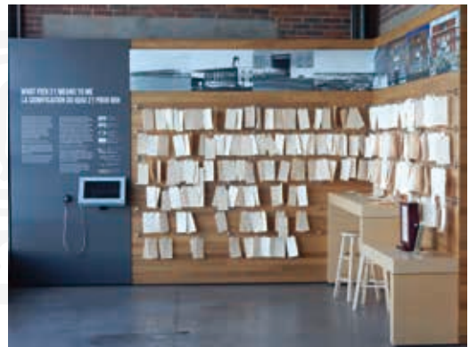
圖35 加拿大國家移民博物館觀眾留言述說心目中的博物館意象