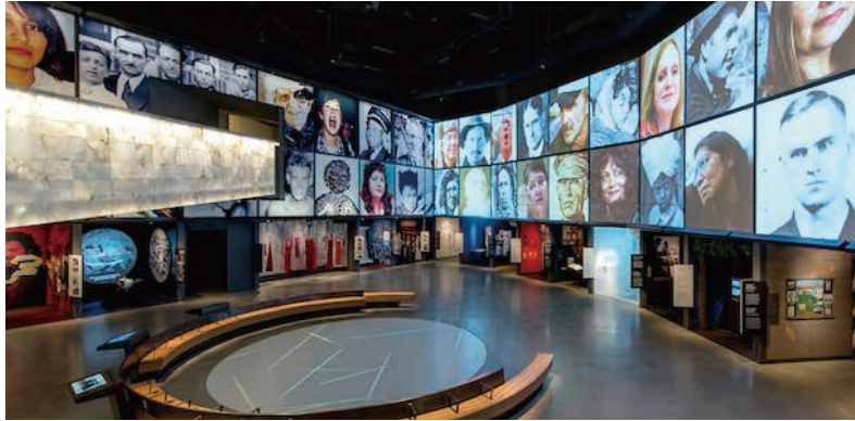
圖16 加拿大人權博物館展廳三：加拿大的人權旅程Canadian Journeys