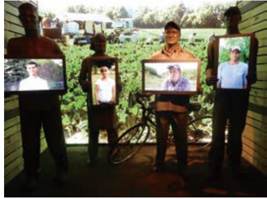
圖27 加拿大人權博物館運用科技強敘述人權故事