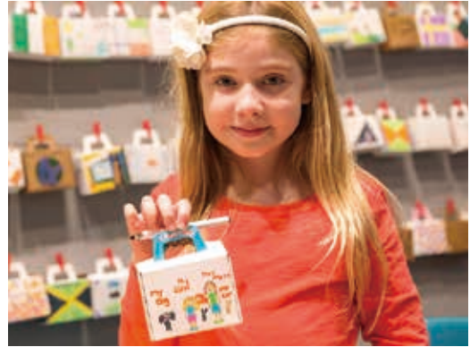
圖33 加拿大國家移民博物館教育活動角