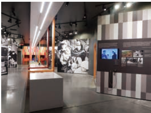
圖30 加拿大國家移民博物館展廳一：加拿大移民故事