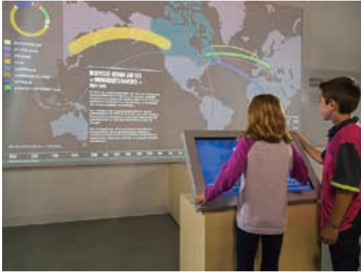
圖32 加拿大國家移民博物館展廳三：探尋自己的移民路徑