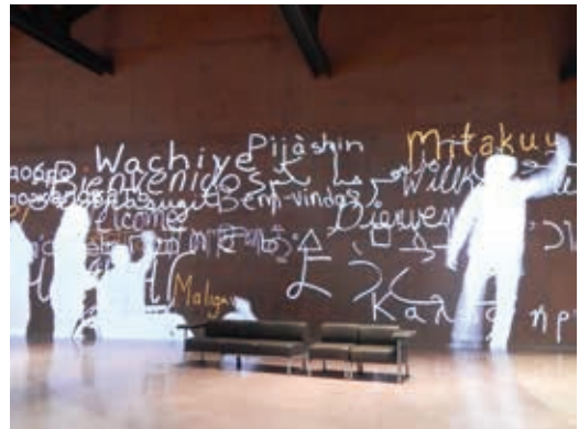
圖25 加拿大人權博物館大廳運用科技投影寫滿全世界各種語言「歡迎」文字