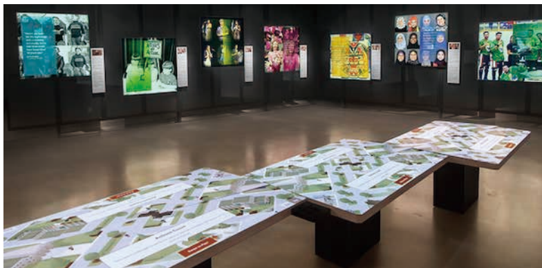
圖21 加拿大人權博物館展廳八：付諸行動Actions Count