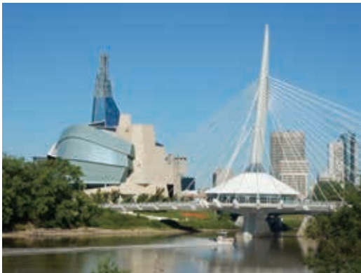
圖24 加拿大人權博物館座落於兩河交會處的弗克斯（The Forks），已然成為溫尼伯的地標