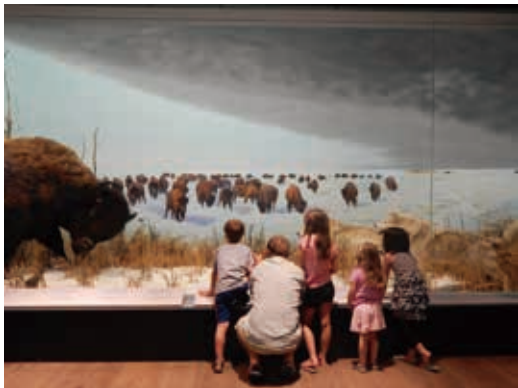
圖3 加拿大自然博物館以自然生態實景復原方式展示