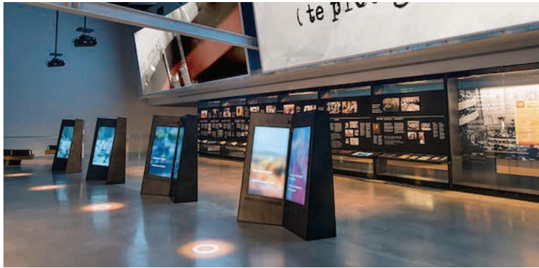
圖19 加拿大人權博物館展廳六：人性的轉折Turning Points for Humanity