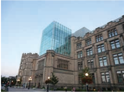
圖1 加拿大自然博物館位於維多利亞紀念博物館大樓