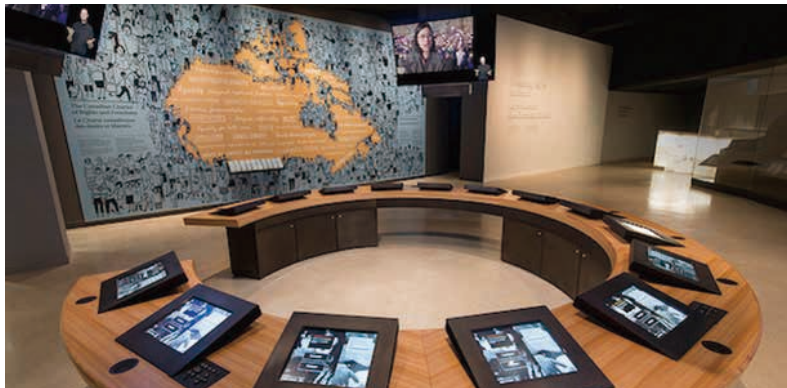
圖17 加拿大人權博物館展廳四：加拿大的人權保護Protecting rights in Canada