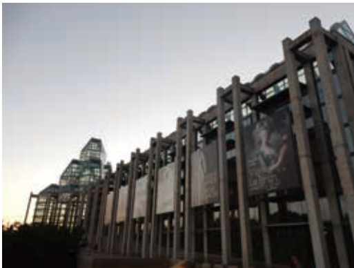
圖9 加拿大國家美術館建物外觀充滿現代感