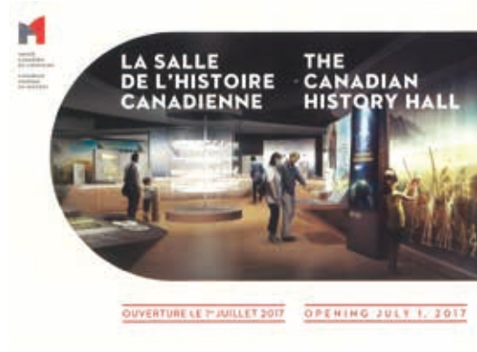
圖8 加拿大歷史博物館的歷史廳將於2017年7月1日慶祝建國150週年時重新開幕