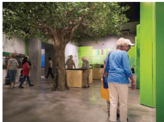
圖31 加拿大國家移民博物館展廳二：尋找自己的移民故事