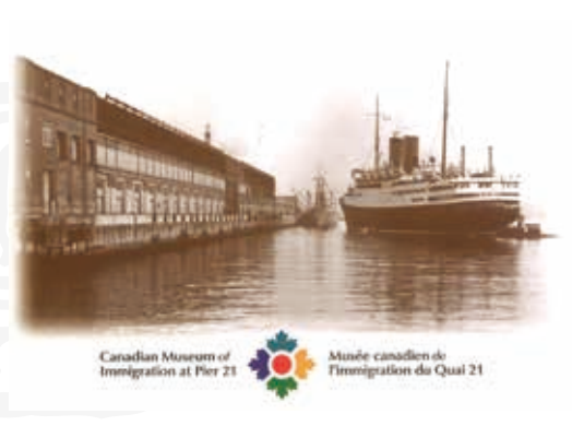
圖29 加拿大移民博物館標誌著移民歷史遺址現場