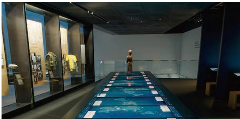
圖20 加拿大人權博物館展廳七：打破沈默Breaking the Silence