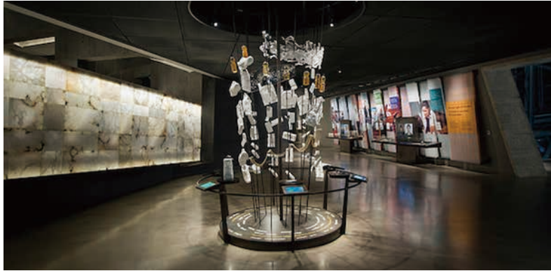
圖22 加拿大人權博物館展廳九：今日人權Rights Today