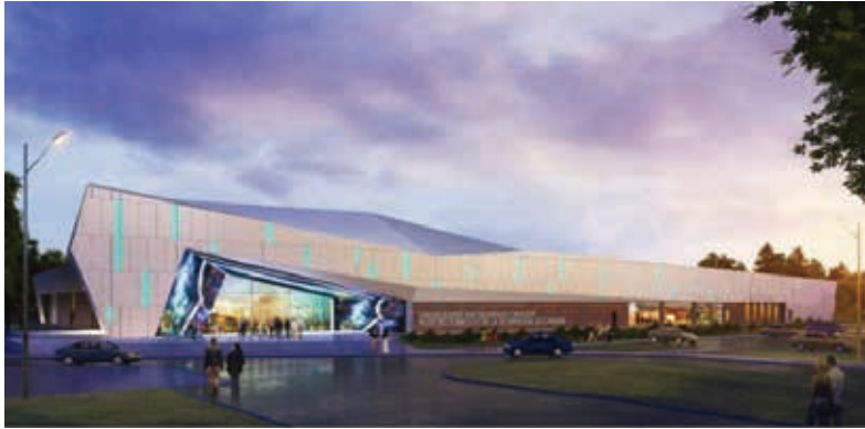
圖13 將於2017年11月重新開幕的加拿大科技博物館示意圖