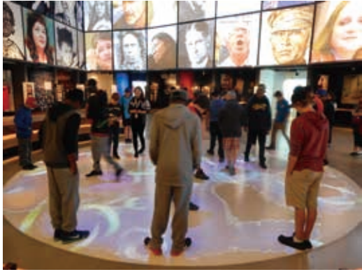
圖26 加拿大人權博物館運用科技強化觀眾參與