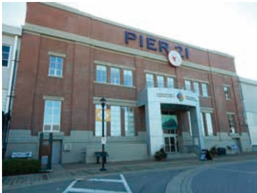
圖28 加拿大國家移民博物館位於東北岸新斯科細亞省哈里法克斯的21號碼頭