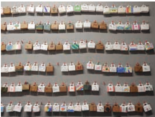
圖34 加拿大國家移民博物館製作滿載夢想與希望行李箱的教育活動