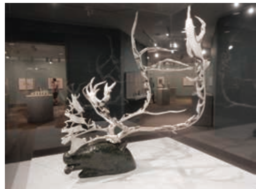
圖12 加拿大國家美術館收藏原住民族藝術作品