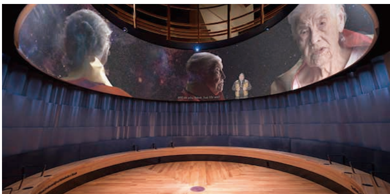
圖15 加拿大人權博物館展廳二：原住民族的「土著觀點」Indigenous Perspectives