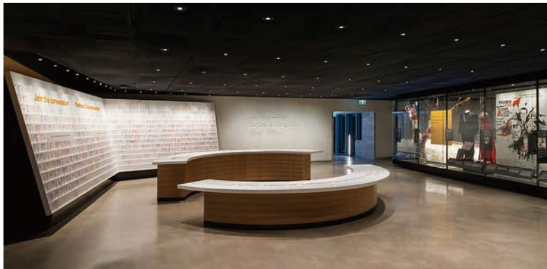
圖23 加拿大人權博物館展廳十：令人鼓舞的改變Inspiring Change