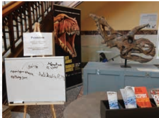
圖4 加拿大自然博物館結合時興手機遊戲公告館內的「寶可夢精靈」排行榜