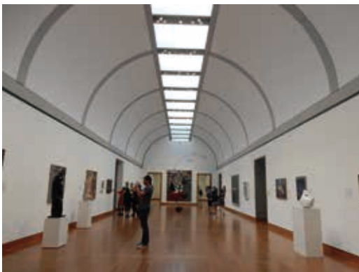
圖11 加拿大國家美術館盡藏加國藝術家作品