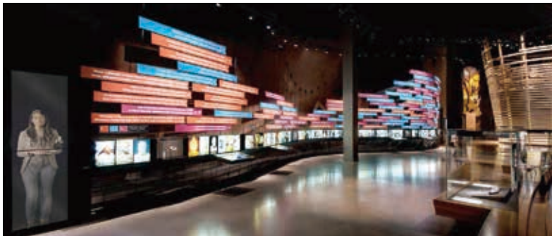
圖14 加拿大人權博物館展廳一：什麼是人權？What are Human Rights?