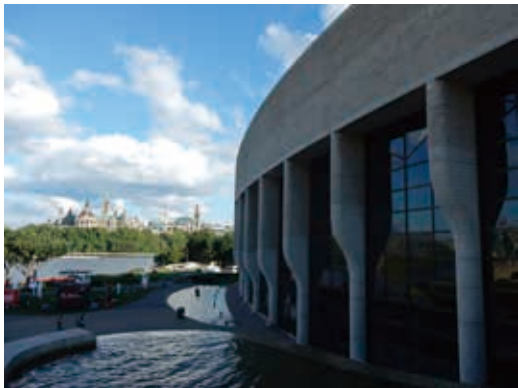
圖5 位於渥太華河畔魁北克省加蒂諾的加拿大歷史博物館